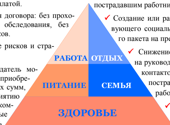
Основы жизни человека